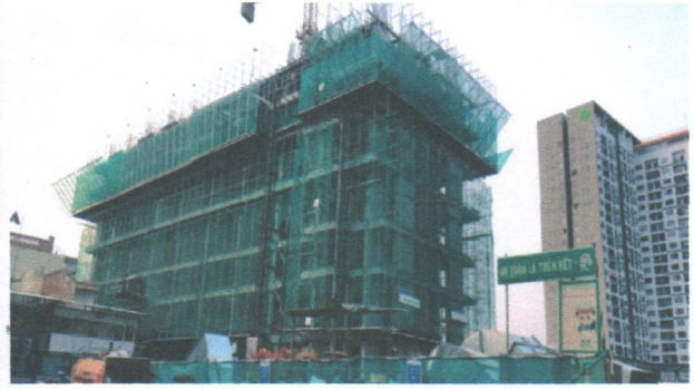
Dự án 152 Điện Biên Phủ 152 Dien Bien Phu Project