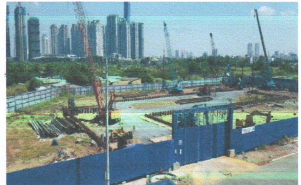
Dự án D'Verano D'Verano Project