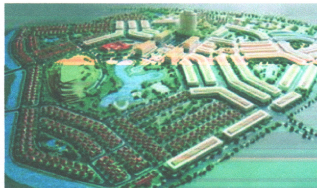
Dự án KDC Sơn Tịnh – Quảng Ngãi Sơn Tịnh – Quang Ngai Residential Project